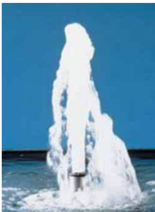
Водная картина насадки Schaumsprudler 35-10E. Высота водной картины 140см.