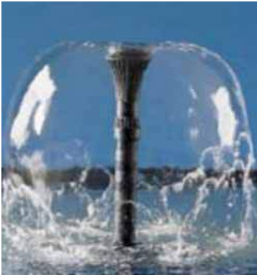
Водная картина насадки Lava 36 - 10К. Диаметр водной картины 96 см.