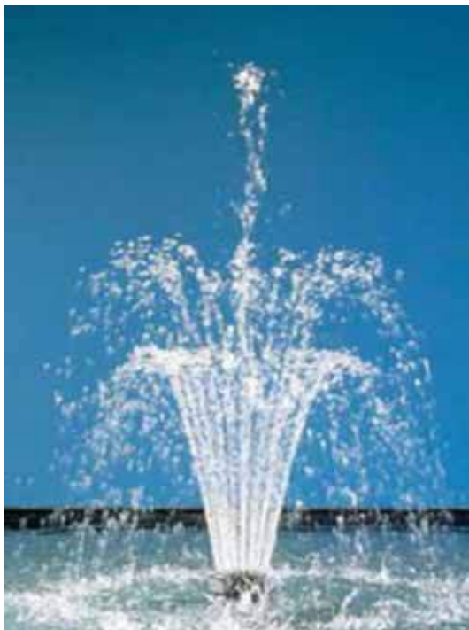
Водная картина насадки Vulkan 37-2,5K Высота водной картины 400 см.

Водные картины трёх дополнительных рекомендуемых насадок.