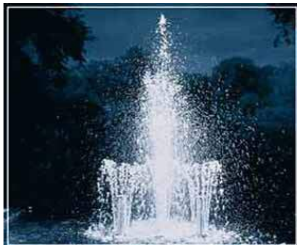
Водная картина 2