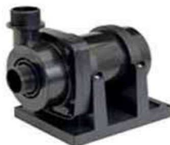
Насос Power-Tec2 14000