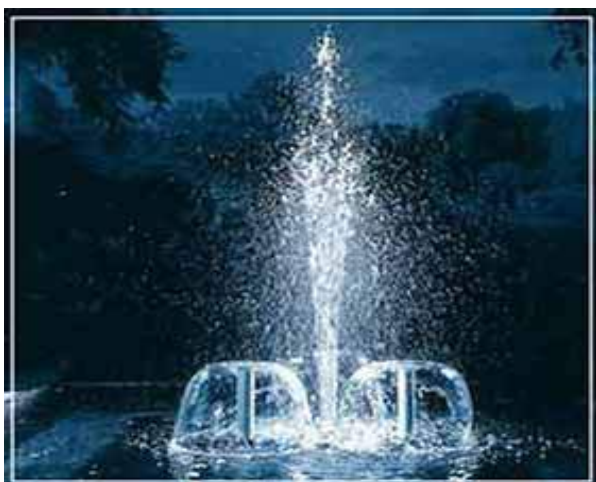
Водная картина 1