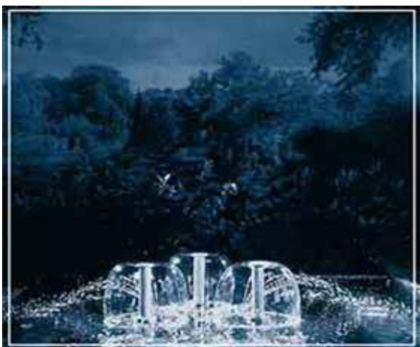
Водная картина 3